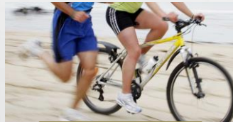
Bike and Run